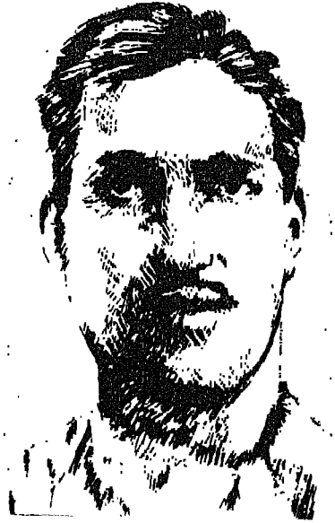
अशफाक उल्ला खॉ

मुझे भली-भाँति याद है कि जब मैं बादशाही एलान के बाद शाहजहाँपुर आया था, तो तुमसे स्कूल में भेंट हुई थी। तुम्हारी मुझसे मिलने की बड़ी हार्दिक इच्छा थी। तुमने मुझसे मैनपुरी षड्यंत्र के संबंध में कुछ बातचीत करनी चाही थी। मैंने यह समझकर कि एक स्कूल का मुसलमान विद्यार्थी मुझसे इस प्रकार की बातचीत क्यों करता है, तुम्हारी बातों का उत्तर उपेक्षा की दृष्टि से दे दिया था। तुम्हें उस समय बड़ा खेद हुआ था। तुम्हारे मुख से हार्दिक भावों का प्रकाश हो रहा था। तुमने अपने इरादे को यों ही नहीं छोड़ दिया, अपने निश्चय पर डटे रहे। जिस प्रकार हो सका कांग्रेस में बातचीत की। अपने इष्ट-मित्रों द्वारा इस